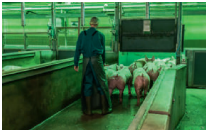
Schweine im Zutrieb zur Betäubung

aufgrund eines Beschlusses des Deutschen Bundestages